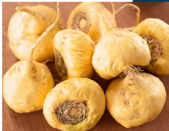
MACA US$ 19.6 M