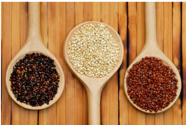
Quinoa US$ 131.7 M