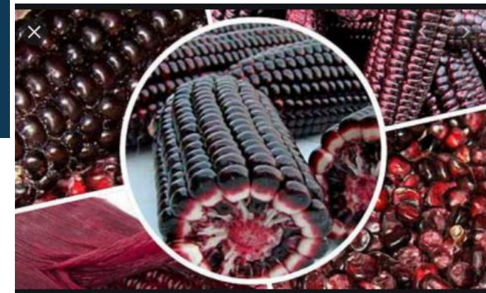
MAIZ MORADO US$ 2.4 M